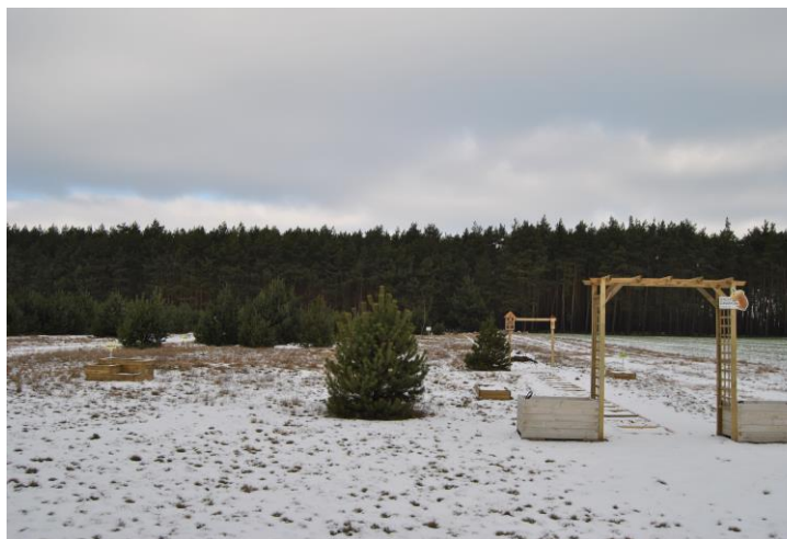
Ogród edukacji sensorycznej