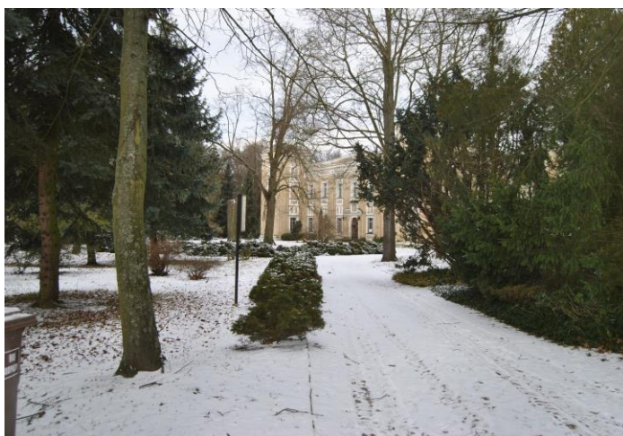
Zespół pałacowo - parkowy