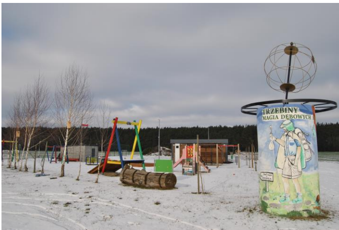
Plac zabaw i świetlica wiejska w tle