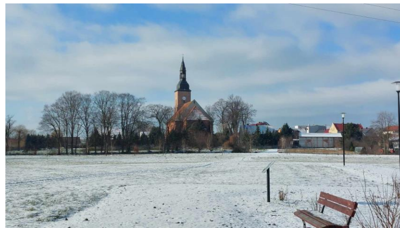
Teren nowego parku w Świąciechowie