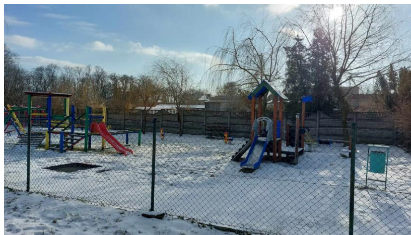
Plac zabaw przy ul. Lasocickiej