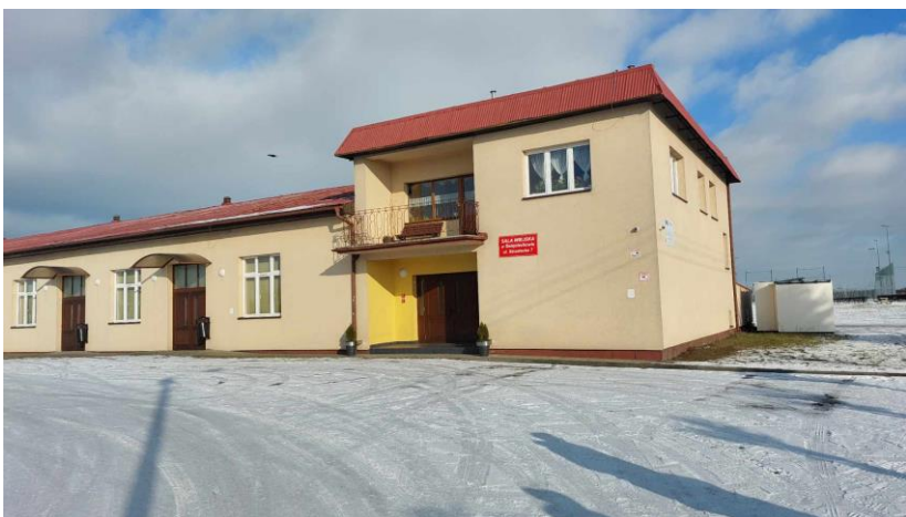
Świetlica wiejska w Świąciechowie