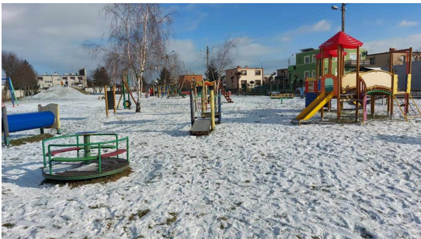
Plac zabaw przy ul. Dojazdowej