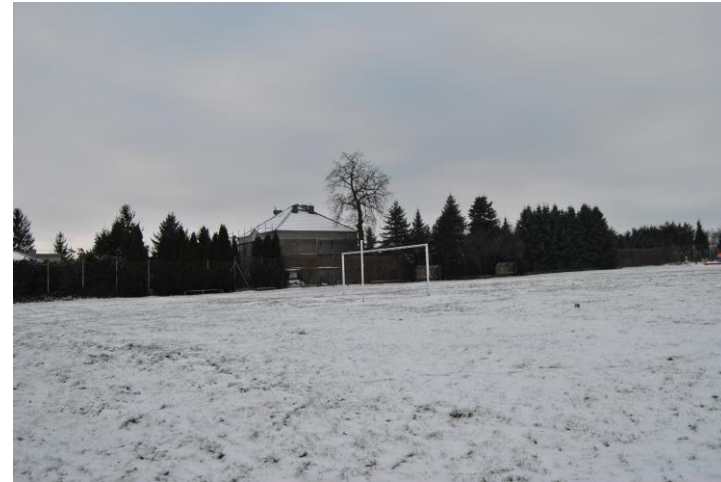
Kompleks rekreacyjno - sportowy