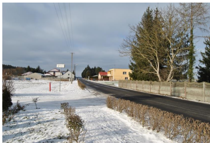
Główna droga przez wieś