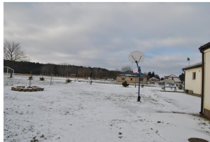
Teren za świetlicą, miejsce na wiatę