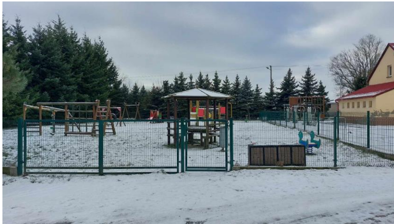
Plac zabaw w Niechłodzie