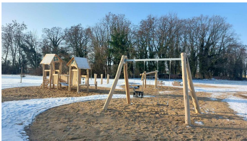
Lasostrefa- teren rekreacyjny na tzw. Niemcu