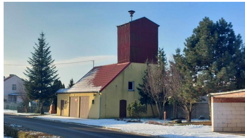
Remiza OSP Lasocice