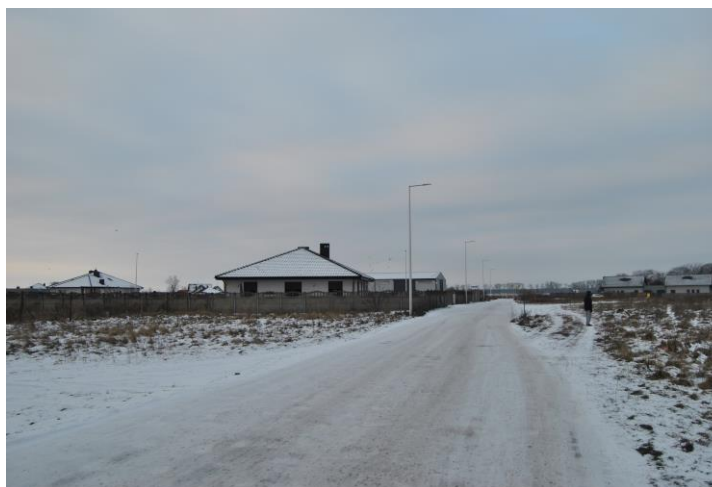
Ulica w nowej części wsi