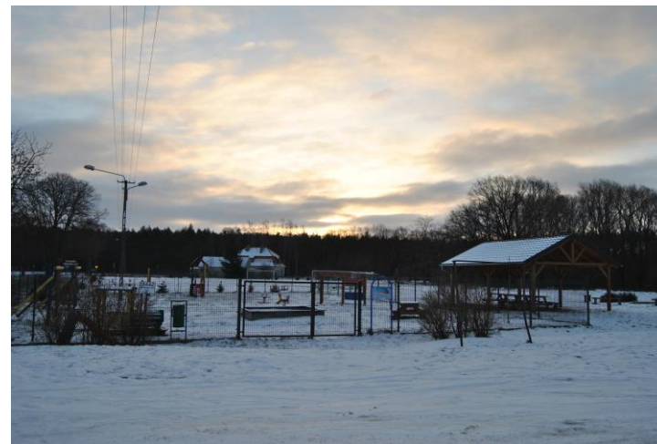
Plac zabaw, wiata i boisko w tle