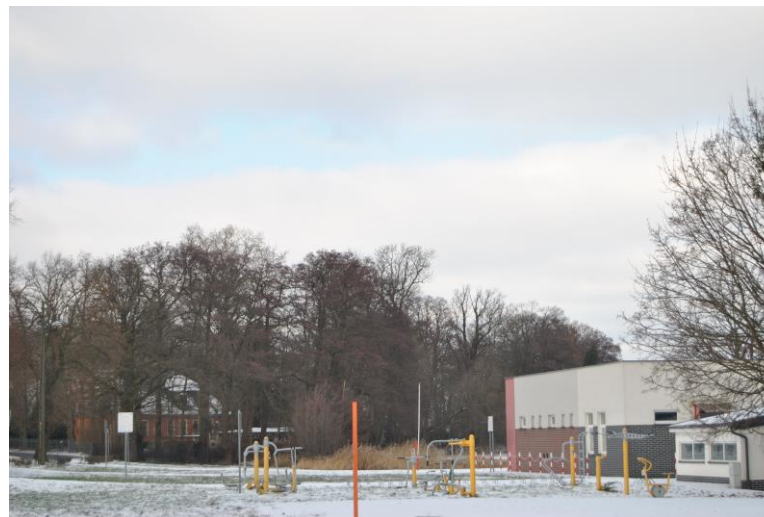
Siłownia zewnętrzna i boisko przy plaży