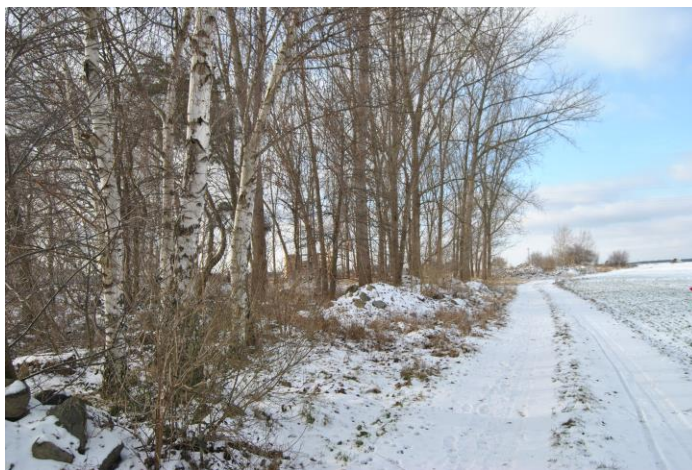
Teren na park rodzinny