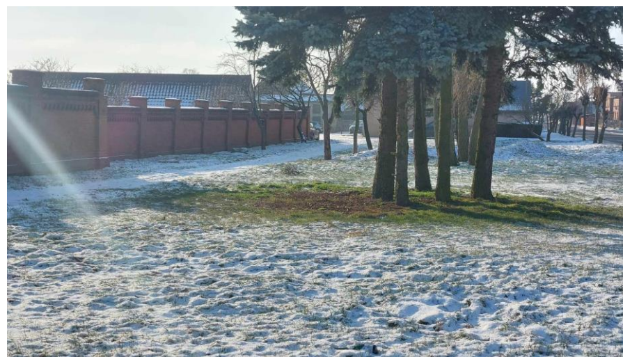
Teren pozyskany od KOWR