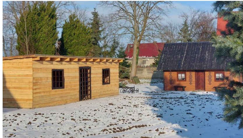
Teren rekreacyjny, Park 700-lecia Długiego Starego