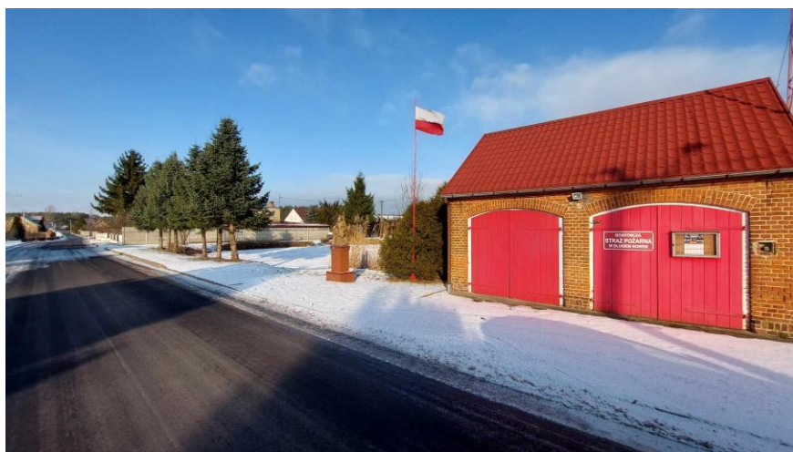
Remiza OSP w Długiem Nowe