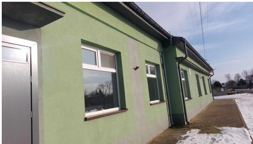
Sala wiejska w Długiem Nowe