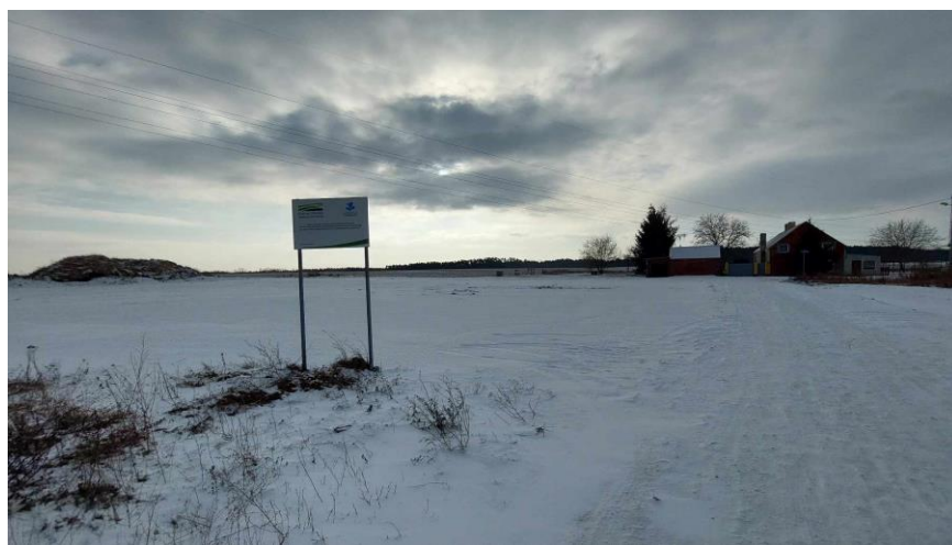
Tereny inwestycyjne (pod boisko wielofunkcyjne)