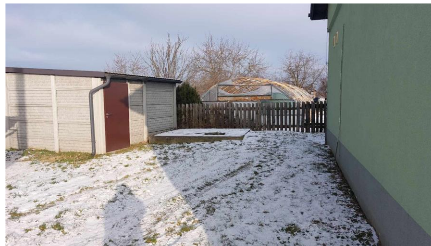
Teren wokół sali